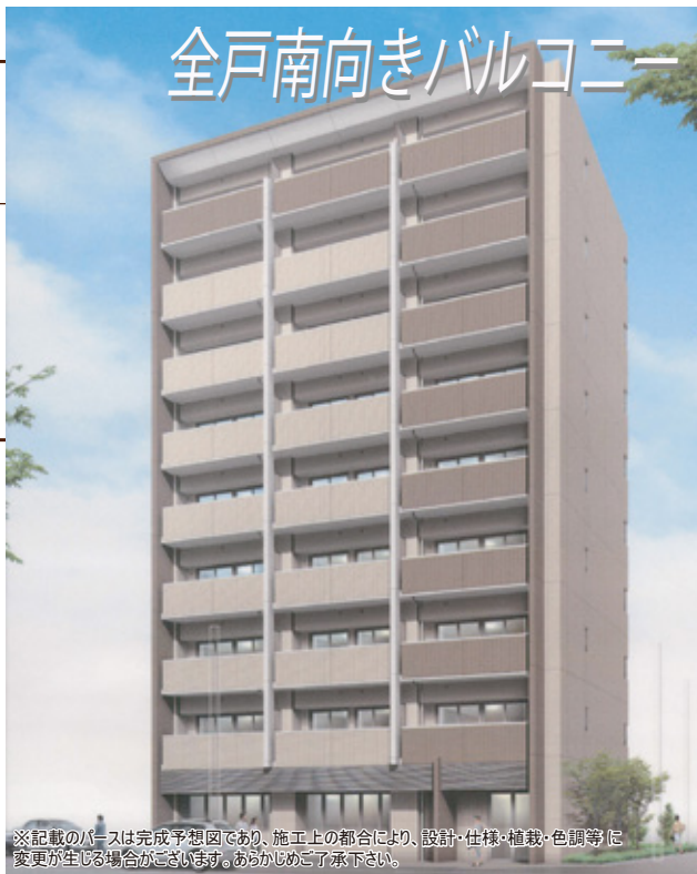
※記載のバスは完成予想図であり、施工上の都合により、設計・仕様・植栽・色調等に 変更が生じる場合がございます。あらかじめご了承ください。