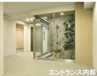
エントランス内部